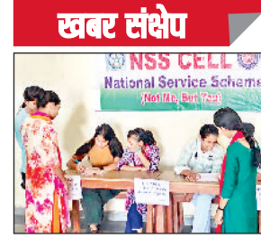
इज्जर। महाविद्यालय परिसर में स्थापित किया गया हेल्प डेस्क।