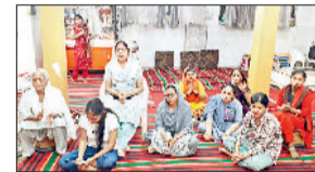
इज्जर। बाबा काशीगिरी मंदिर में भजनों का आनंद लेते हुए श्रद्धालु।