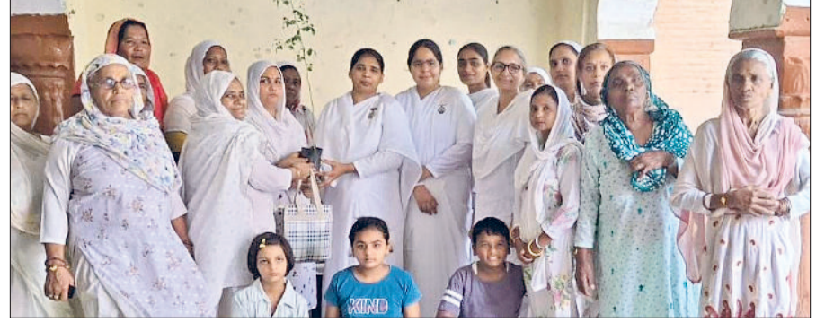
बहादुरगढ़। ग्रामीणों को पौधे भेंट करती ब्रह्माकुमारियां।