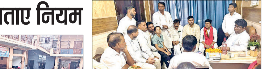
बहादुरगढ़। बैठक में पदाधिकारियों से चर्चा करते जिलाध्यक्ष विकास वाल्मीकि।

बच्चों को अंजान व्यक्ति से सतर्क रहने की सलाह दी गई। आसपास कोई अपराधी किस्म का व्यक्ति दिखने पर तुरंत डॉलर 112 पर कॉल करके पुलिस को सूचना देने