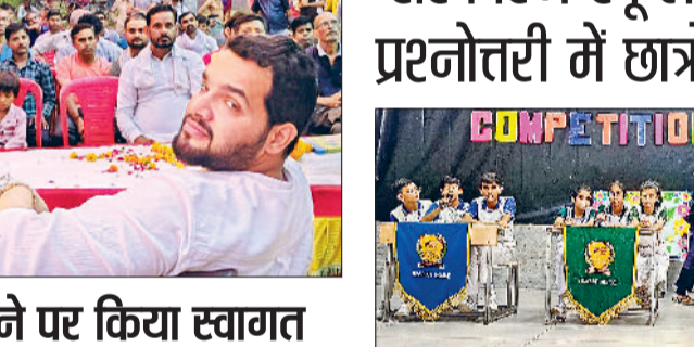
हरिभूमि न्यूज ►► इज्जर